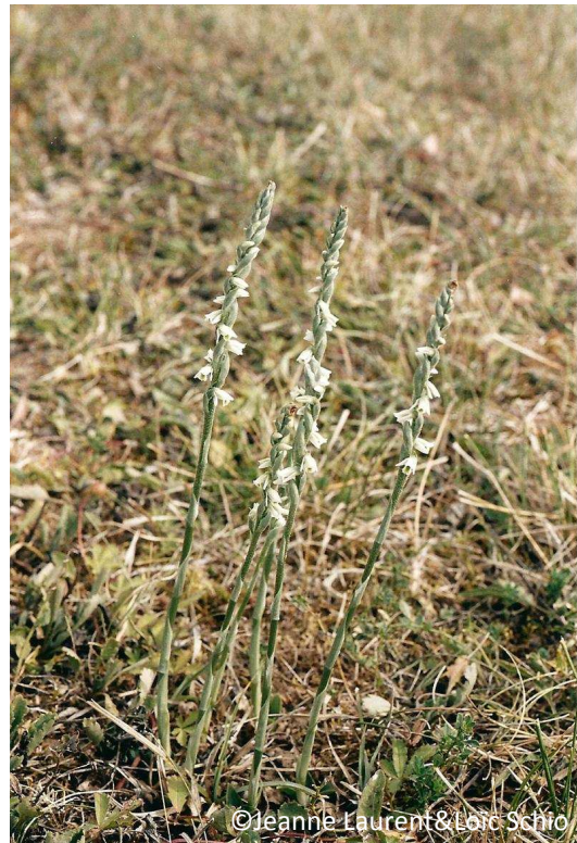
34 - Spiranthe d'automne