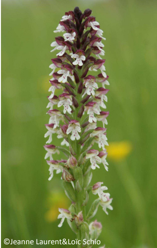
31 - Orchis brûlé