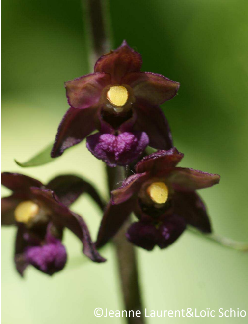
17 - Épipactis pourpre-noirâtre (fleurs rouges pourpres)