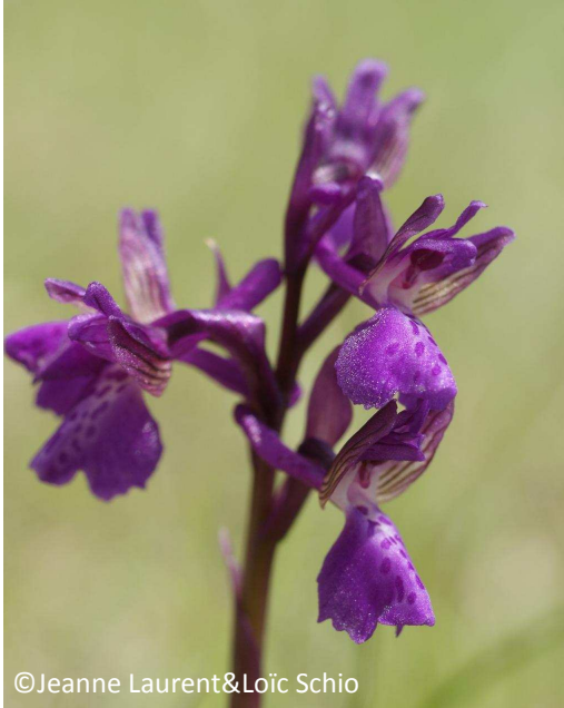
9 - Anacamptis morio (Orchis morio) (sépales avec nervures vertes)