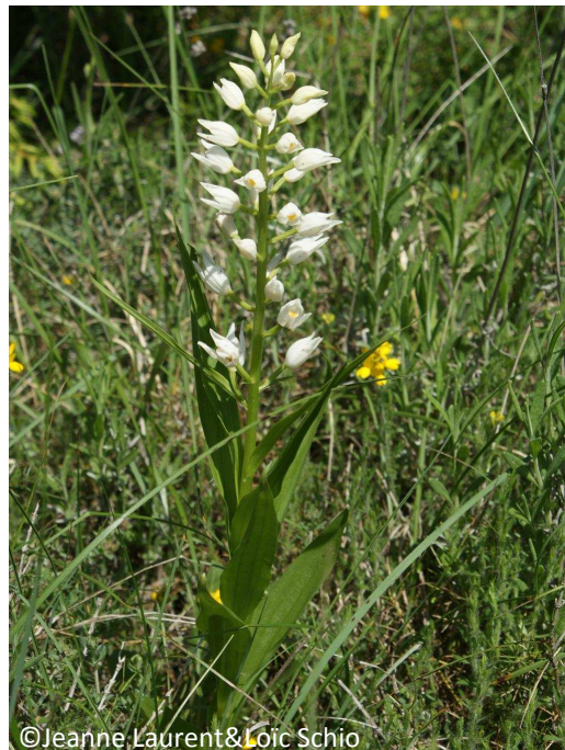
12 - Céphalanthère à longues feuilles (fleurs blanches en épi dense)