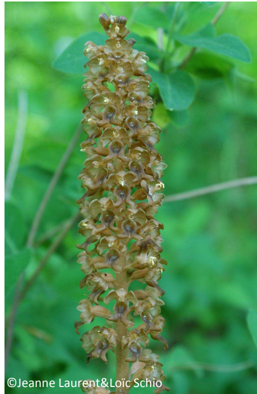
32 - Néottie nid d'oiseau