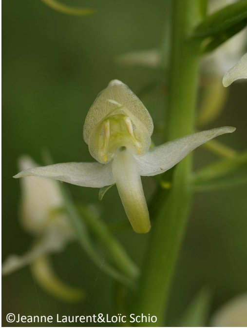
23 - Platanthère verdâtre (étamines divergentes)