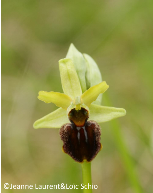
1 - Ophrys araignée (sépales verts - labelle arrondi)