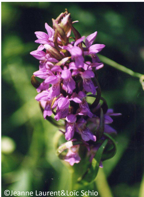
15 - Orchis incarnat (fleurs petites – labelle avec dessins en forme de boucle)