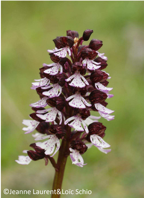
5 - Orchis pourpre (sépales et pétales en casque pourpre)