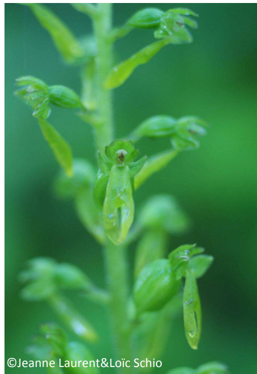
30 - Listère ovale