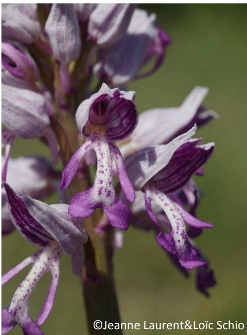
7 - Orchis militaire (casque blanc/rosé – labelle à lobes élargis)