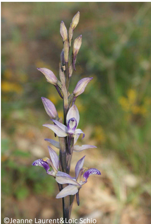
29 - Limodore à feuilles avortives