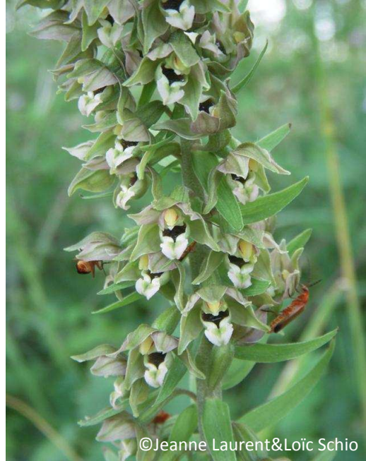
18 - Épipactis helleborine (labelle vert clair)