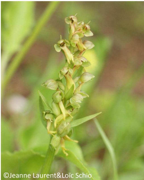
25 - Orchis grenouille