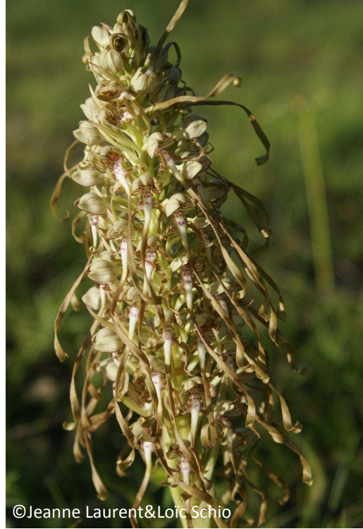
28 - Orchis bouc