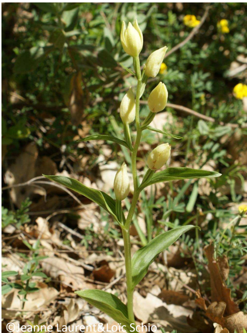
11 - Céphalanthère pâle (fleurs blanc/jaunâtre à l'aisselle des feuilles)