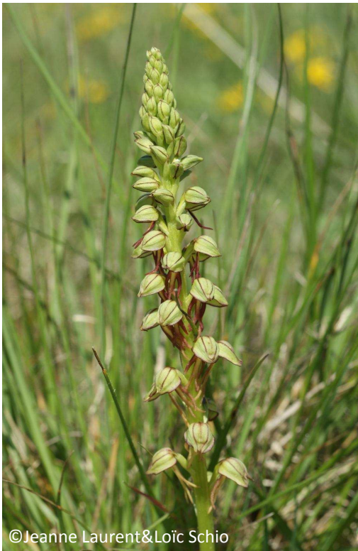
33 - Aceras homme-pendu