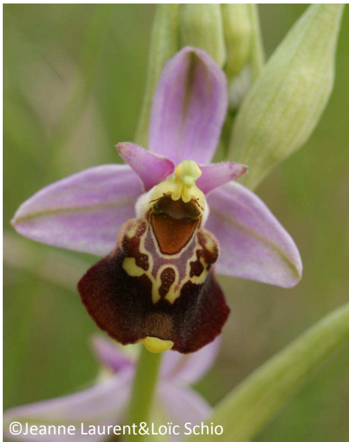
3 - Ophrys frelon (sépales roses – labelle en losange)