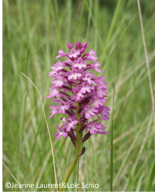
10 - Anacamptis pyramidal (Orchis pyramidal) (inflorescence en épi dense conique)