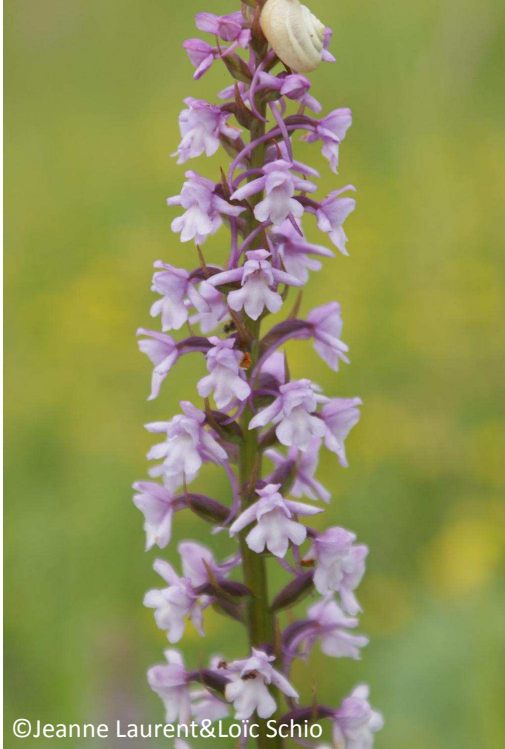
27 - Orchis moucheron