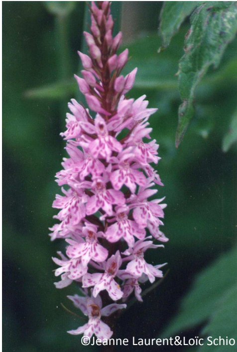
13 - Orchis de Fuchs (labelle profondément trilobé)